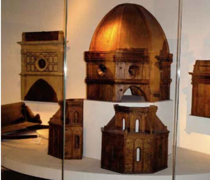
^ Рис. 4. Рабочие модели для строительства купола Санта Мариа дель Фьоре. Ф. Брунеллески и его помощники, Италия, начало XV в. Модели в ремесле имели смысл простой денотации – они указывали на натуральное и достижимое, пусть даже и весьма приблизительно