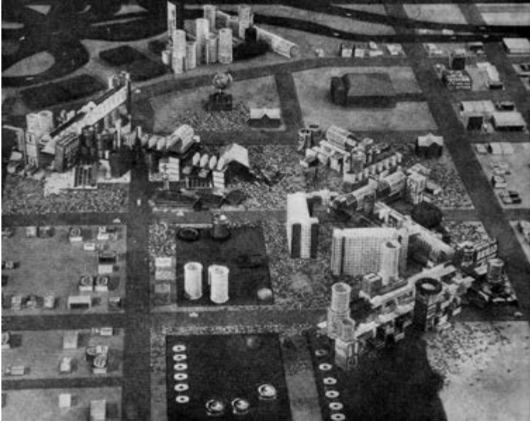
< Рис. 6. Макет кампуса Университета Шоу. Hardy Holzman Pfeiffer Associates (ННРА), США, 1971

«Предлагаемые нами рисунки и макеты способствуют переоценке методов раскрытия архитектурного замысла. В самом деле объекты на наших макетах становятся символами, вместо того, чтобы быть реальными деталями. Кочаны капусты изображают деревья, бигуди становятся многоэтажными зданиями, структурные ткани дают более наглядное представление о качестве окружающей среды, чем специально подобранные материалы, обои воссоздают ритм чередования пустых и заполненных пространств, а газетная бумага заменяет плиточные покрытия...» [8, с. 47]. Попытка вырваться из тенет репрезентации еще глубже погружает в них