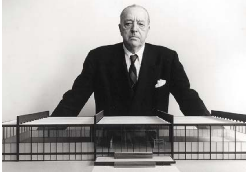
^ Рис. 5. Л. Мис ван дер Роэ с моделью здания Crown Hall, США, 1950-е Для Миса модель – точное и строгое средство, но это уже не простой знак вещи. Здесь вступает в права репрезентация – выражение чего-либо посредством иного. Модель коннотирует высшие смыслы архитектурной идеологии Миса, она трансцендентна самой себе; предполагаемые ею интерпретации намного превышают задачу изображения «объекта»

имеют место), мы оставляем в стороне от основной проблематики настоящей статьи, хотя полностью игнорировать их, разумеется, невозможно. Нам здесь более важны «внутренние» сложности и проблемы сформировавшегося типа проектного мышления.