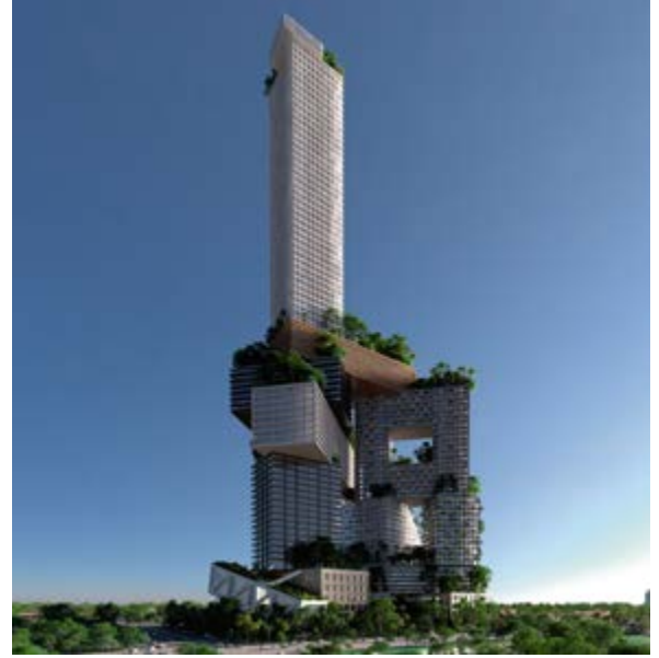
^ Рис. 3. Peruri 88 – Вертикальный урбанизм для Джакарты, MVRDV, 2012

Сегодняшние технологические возможности (или даже завтрашние) уже не способны скрыть мертвенность языка и отсутствие понимания ценностей и целей. Но все еще остается «дежурный» слой модернистских коннотаций – выражение «причастности к современности», давно уже ставшее риторической фигурой