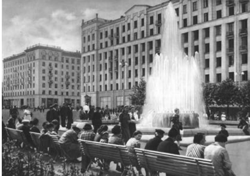
^ Москва. Советская площадь. Реконструкция 1939 г.