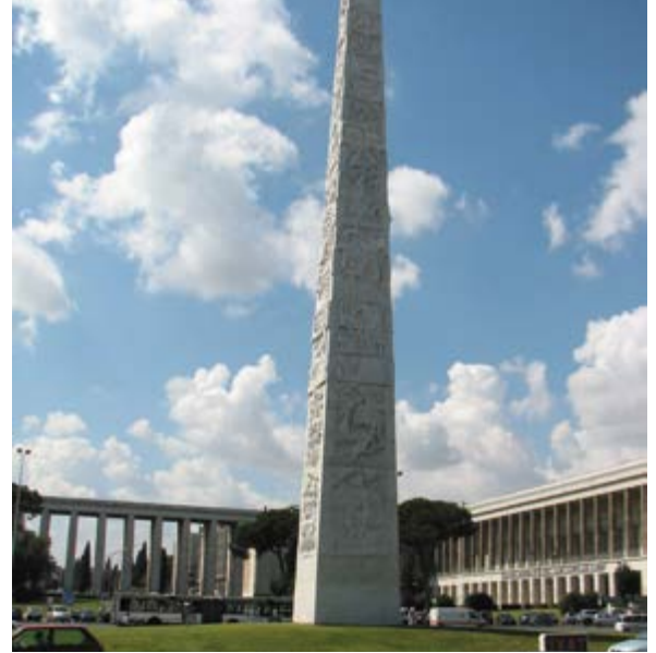
^ Рим, Форум Муссолини, площадь

можно формирование гражданского городского сообщества и, говоря шире, вообще национального гражданского общества.