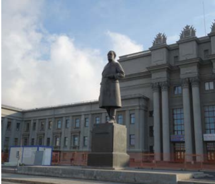
^ Площадь Куйбышева