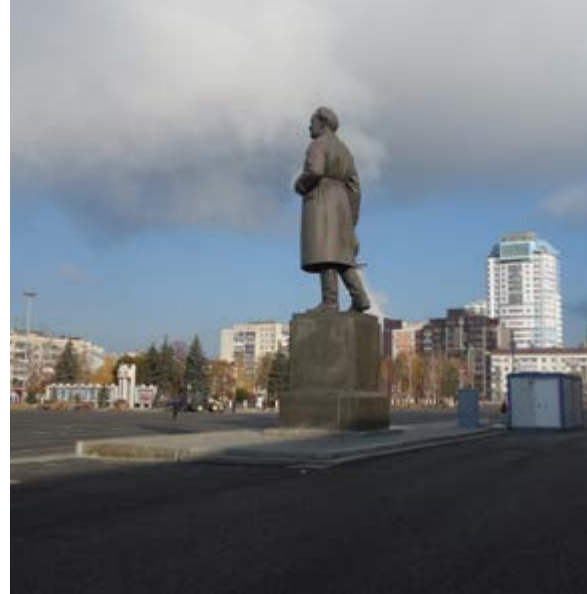
^ М. Г. Манизер. Памятник Валериану Куйбышеву на площади Куйбышева в Самаре, 1938

ЕБ А что, в современных условиях это единство можно ощущать только на площади? И является ли толпа на площади некой общностью?