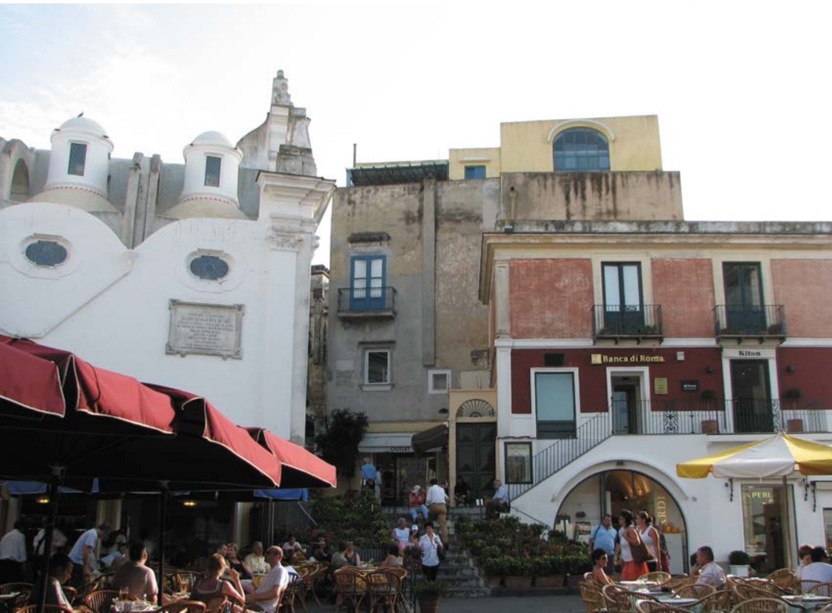
v Капри. Площадь