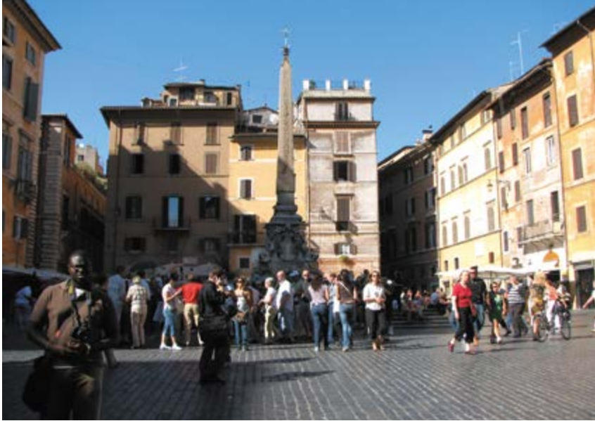
^ Рим. Площадь