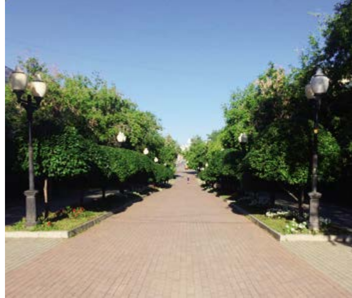
^ Екатеринбург, бульвар на пр. Ленина

французском просторечии XVII века. В XVIII слово подхватили англичане, а затем оно уже в XIX веке снова вернулось во Францию, но уже в английской транскрипции – picnic. Глагол picquer означал «поклевать, мало есть», picque – нечто малозначащее. Устроить пикник ( faire un pique-pique ) – означало позавтракать или пообедать в живописном месте, на природе.