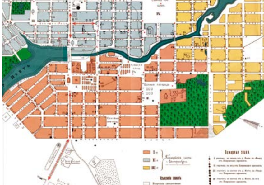
^ План города Екатеринбурга 1910 года с указанием бульваров

буржуа, чиновники и разночинцы. Появление на бульваре светского льва или львицы было событием: бульвардье обсуждали, как он или она были одеты, с кем вели беседу, в какое кафе зашли.