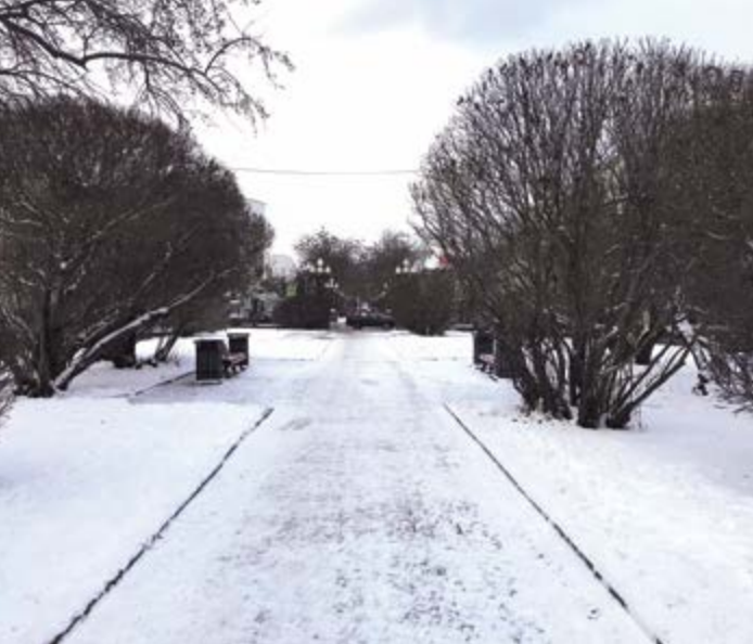
^ Пустующий бульвар на пр. Ленина в Екатеринбурге