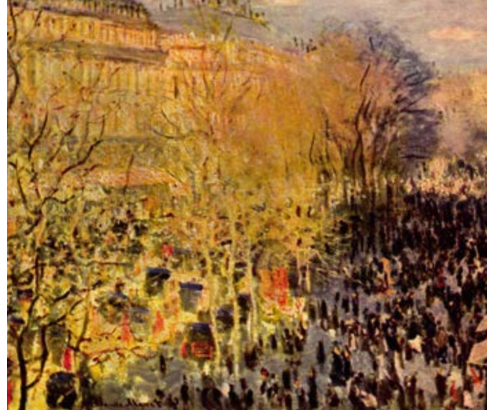
^ Бульвар Капуцинок в Париже 1873 г. Клод Моне

Keywords: boulevard; history of occurrence of boulevards; philosophy of the Enlightenment and Romanticism; contemplative aristocrat; flaneur-bourgeois; boulevard culture; democratization of the society of the early 20th century; life of boulevards in the 20th century; death of traditional boulevards.