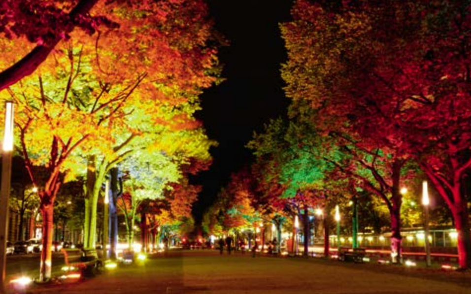
^ Бульвар Унтер-ден-Линден в Берлине.