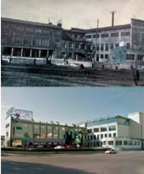
^ Дом Культуры