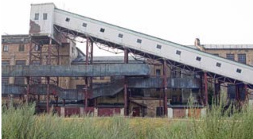
v Радиозавод и ТЭЦ-2

Наконец, создаются творческие выставочные очаги: творческое пространство «Перцель», галерея «Революция», Галерея Виктора Бронштейна. Сегодня они существуют сами по себе, обособленно. Но благодаря появлению этих объектов происходит объединение творческих, равнодушных людей, которые со временем могут повлиять и на городское пространство.