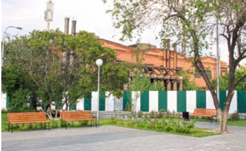
^ Иркутский завод тяжелого машиностроения им. В. В. Куйбышева

индустриальная эстетика разрушается либо навсегда скрывается под новыми конструкциями. Памятники индустриального мира – ресурс архитектурного разнообразия города, создания индивидуальности новых, неиндустриальных зданий и пространств. Но эта возможность остается невостребованной: городская среда, созданная индустриальным миром, деградирует. При этом воспроизводятся худшие свойства бывшей околоиндустриальной среды – закрытость, отсутствие вечерней активности, человечности.