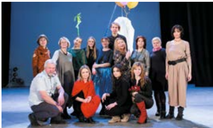
^ Коллективный показ «Тайны цвета», 2017

Рассматриваются основные творческие принципы Центра детского творчества архитектуры и дизайна «Пирамида», его история. Описываются методические приемы обучения, проекты Центра, акции. Подчеркивается значение принципа непрерывного художественного образования для детей.