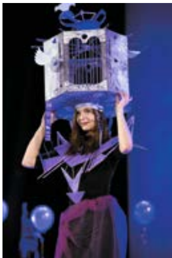
^ «Фиолетовый» показ «Тайны цвета», 2017

В каждой возрастной группе свой преподаватель – автор программ, знаток возрастных особенностей. Занятия проходят два раза в неделю, их продолжительность – два астрономических часа.