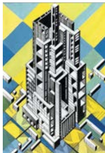
^ Гимельштейн Евгения, 15 лет