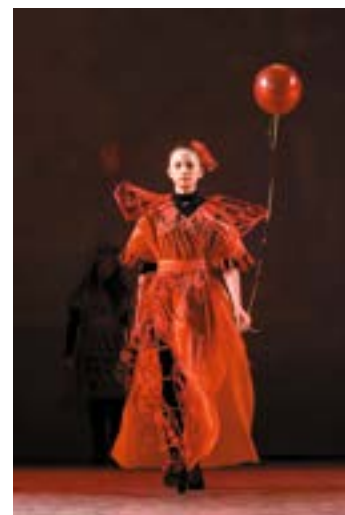
^ «Красный» показ «Тайны цвета», 2017