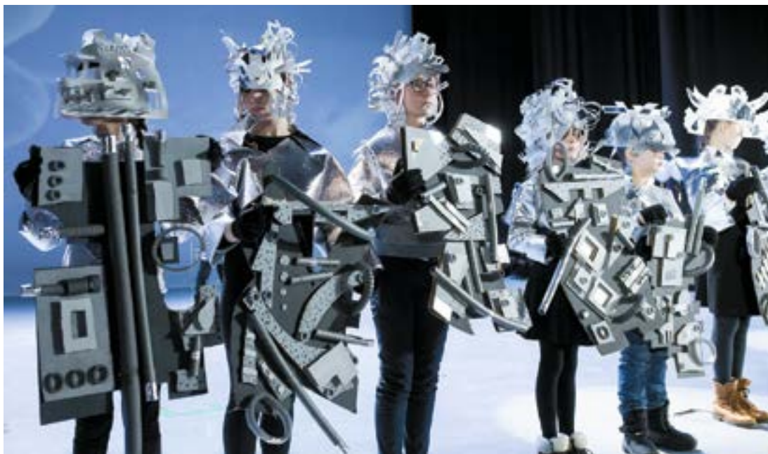
v «Серый» показ «Тайны цвета», 2017