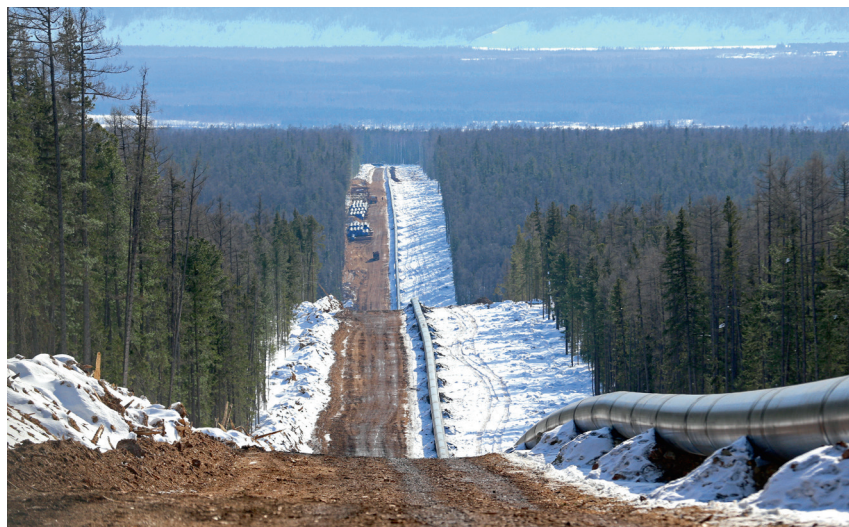
^ Строительство магистрали «Сила Сибири»

– стрела – интенсификация вектора и открыто выраженной агрессия; – ось – намерение переворота (оборачивания?) окружающего ее мира: «ось зла», например; – лея – след предначертанный; задает движение, но не ясно, в какую сторону и непонятно, зачем. Апологеты и сегодня не устают находить леи на снимках Google – некоторые из них впечатляют, но остаются бесплодными; – отрезок – как правило, выражает равнодушие к тому, что расположено между крайними точками. Но он может быть красив, как, например, мост (что делает метафору моста одной из привлекательных); – путь (тракт, магистраль) – дорога «туда и обратно», локализация равновесных полюсов (ареалов или регионов), путь торговли и обменов, дорога пилигримов; – направление (как в России без него!) – посыл куда-либо, в т. ч. царский – таковы первые героические экспедиции в неизведанные земли; интенциональность движения, у которого может и не быть ясной цели (культ дороги у битников и эскапизм хиппи).