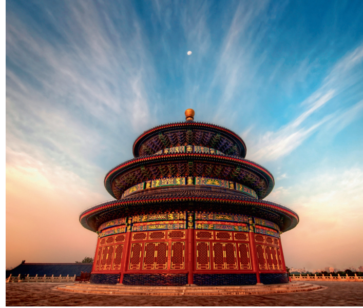
^ Храм Неба в Пекине