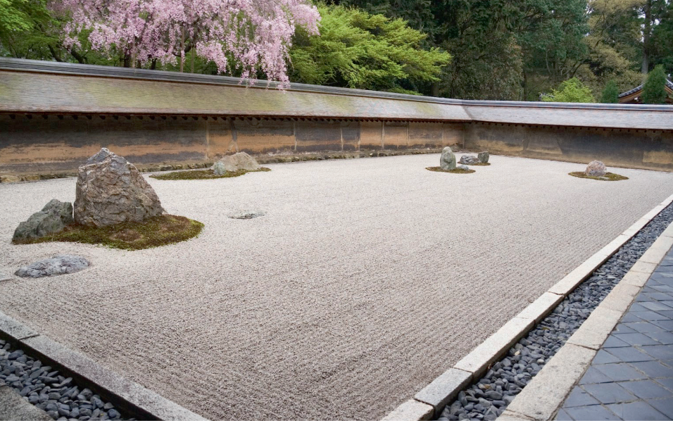
^ Сад камней в Киото