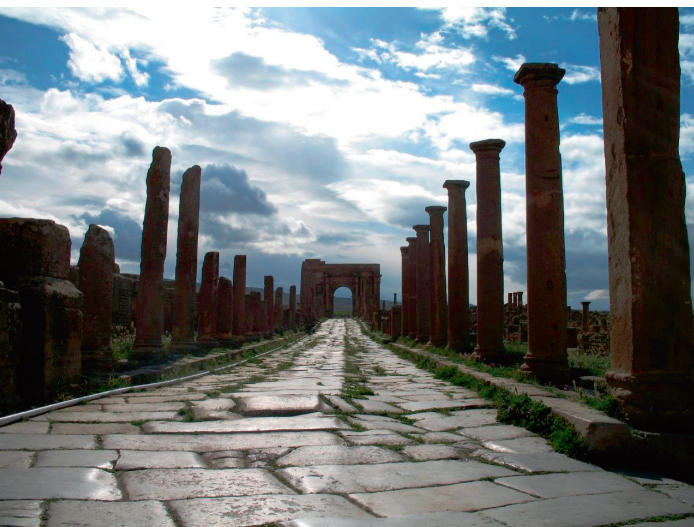
^ Римские дороги – пути экспансии