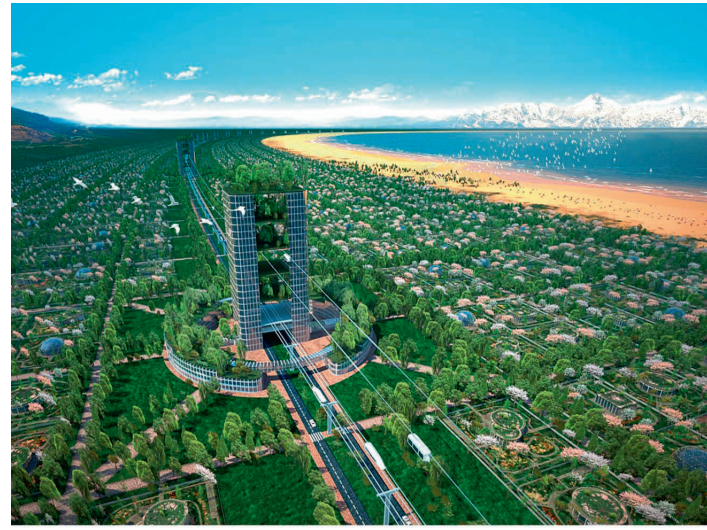
^ Smart Linear City, проект для Индии

наполняемые содержанием по мере необходимости и образования. А реальные узлы – города и регионы человеческого обитания, обитания многовекового.