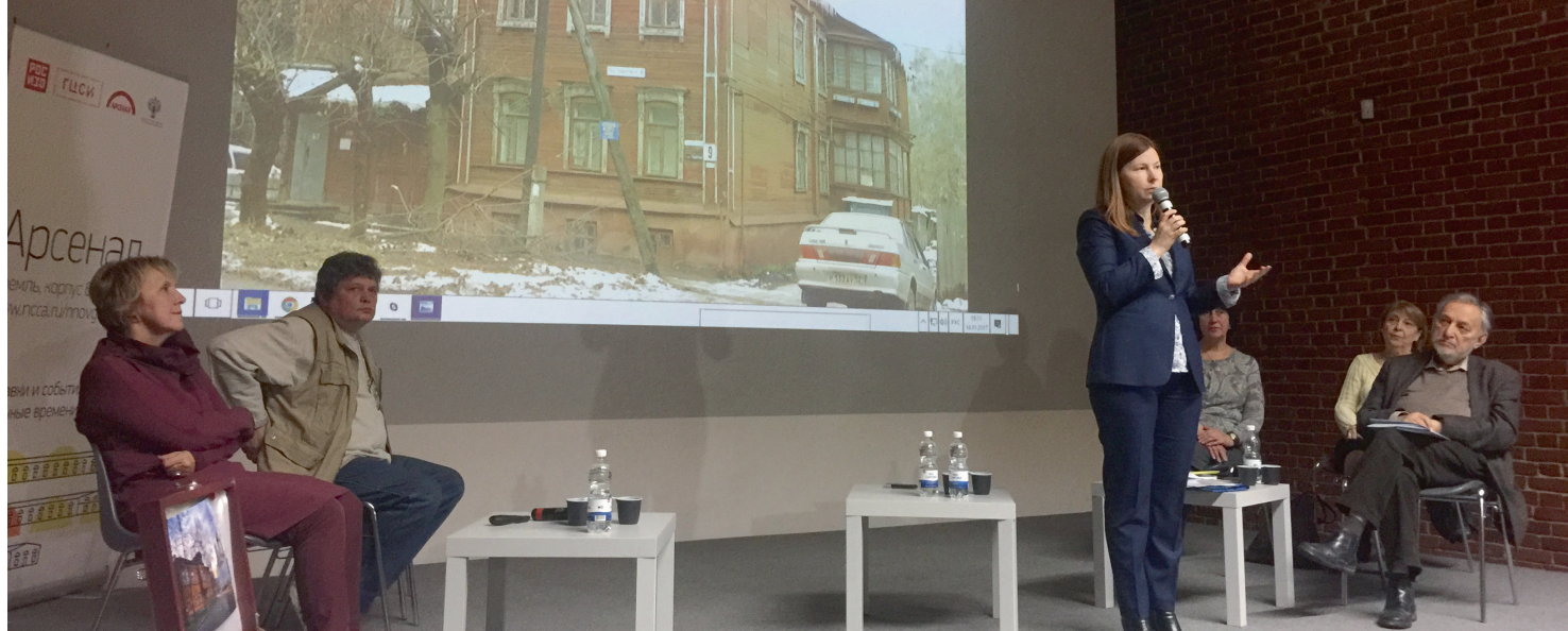
^ Выступление главы города Нижнего Новгорода Елизаветы Солонченко