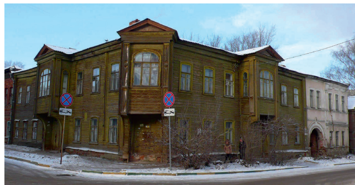
^ Дом 49/6 по ул. Студёной