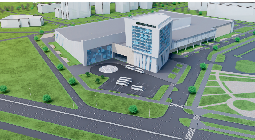
^ Проект архитектурного бюро «АРДИС» (Красноярск)