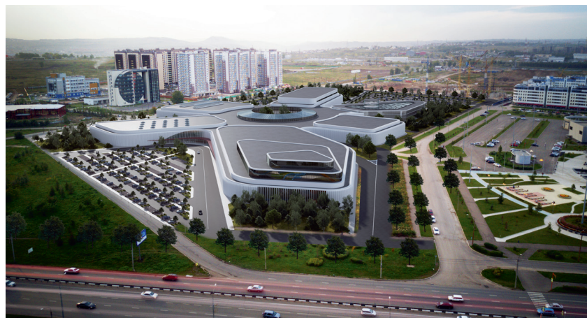
^ Проект «KS AQUA FUN PROJECT GROUP» (Рига, Латвия)