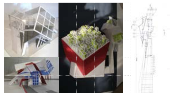
ГЛАВА 2. ОБРАЗОВАТЕЛЬНЫЕ МЕТОДИКИ В ДИЗАЙНЕ: ПОГРУЖЕНИЕ В ВИРТУАЛЬНОЕ И ОСОЗНАНИЕ ПРЕДМЕТНО-СРЕДОВОЙ МАТЕРИАЛЬНОСТИ. ОПЫТ КАФЕДРЫ ДИЗАЙНА ИРНИТУ

В целом монография «Дизайн сегодня: из виртуального пространства к предметно-средовой реальности. Школа дизайнера в Иркутске» представляет собой оригинальный авторский труд, завершённый и методически выстроенный и может быть рекомендована как научное издание для специалистов в сферах архитектуры, дизайна, искусств и культуры, а также в качестве учебного пособия для высших учебных заведений, готовящих специалистов по архитектуре и дизайну, монументально-декоративному декоративно-прикладному и искусству.