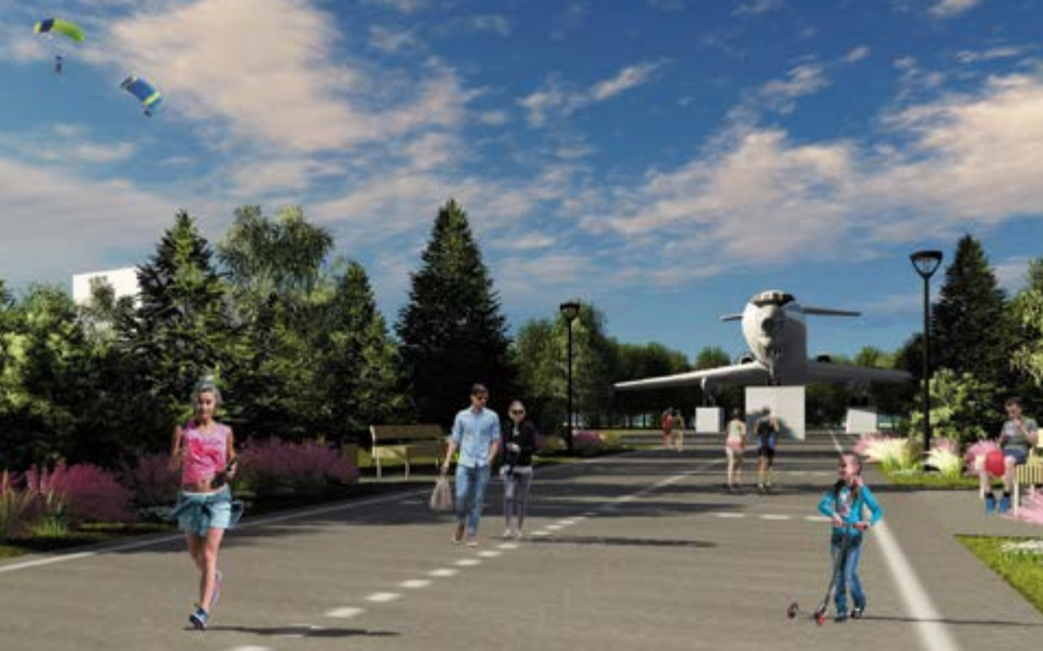
^ Авиапарк визуализация