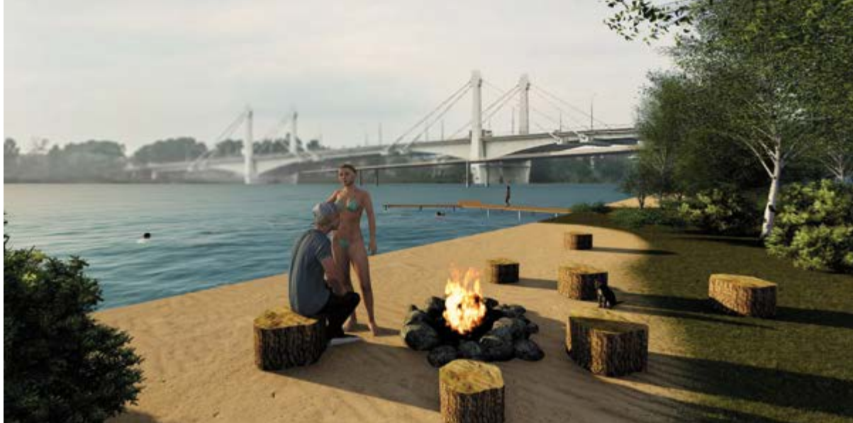
^ Авиапарк. Визуализация