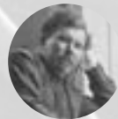
Чернышев Леонид Александрович (1875–1932) Художник, архитектор, общественный деятель