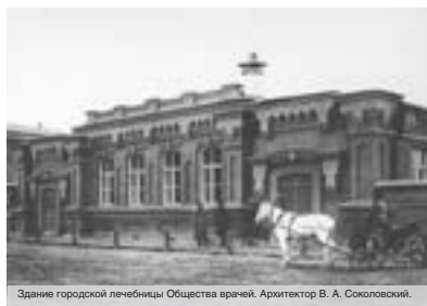
Здание городской лечебницы Общества врачей. Архитектор В. А. Соколовский.