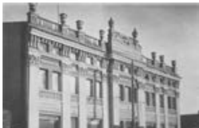
Здание общества попечения народного образования. Архитектор С. Г. Дриженко