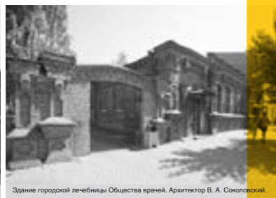
Здание городской лечебницы Общества врачей. Архитектор В. А. Соколовский.

20 апреля в Государственном научно-исследовательском музее архитектуры им. А. В. Щусева (МУАР) в Москве открылась выставка об архитектуре и истории Красноярска. Выставка «Провинция. Архитектура Красноярска конца XIX – начала XX столетия» – это уникальная возможность познакомиться москвичей и гостей столицы с архитектурой замечательного сибирского города.