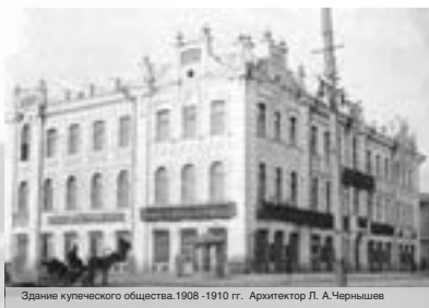
Здание купеческого общества. 1908–1910 г.г. Архитектор Л. А. Чернышев