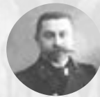
Дриженко Сергей Георгиевич (1876–1946) Известный красноярский архитектор

Основоположники формирования архитектурного облика Красноярска начала XX века