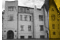
Сохранение архитектурного наследия Красноярска.