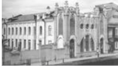
Здание электротрамва «Художественный» 1915 г. Архитектор С. Г. Дриженко