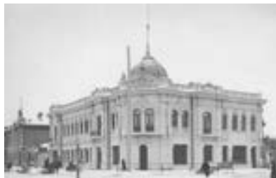
Дом М. Х. Зельяновича. 1912 г. Архитектор В. А. Соколовский. Скульптор А. Г. Попов