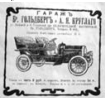
^ Братья Гольдберг первые в Иркутске открыли гараж по обслуживанию автомобилей