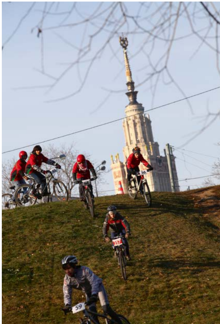
v Осенний веломарафон

диона – тир и самый большой пруд из каскада прудов. К сожалению, вторая очередь строительства так и не была реализована.