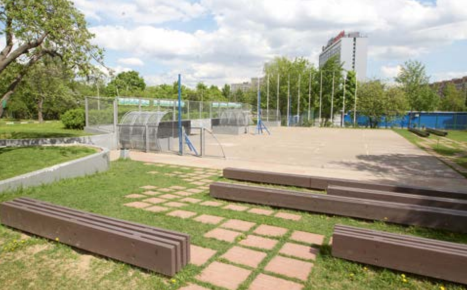
^ Городские площадки