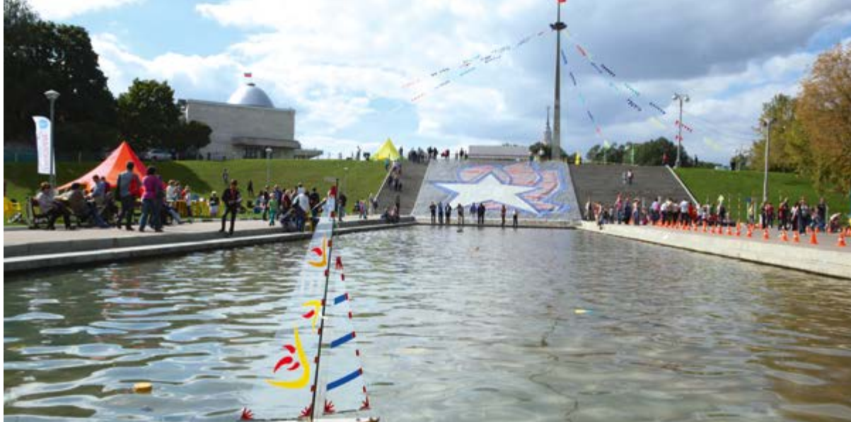
< Соревнования учеников судостроительного кружка