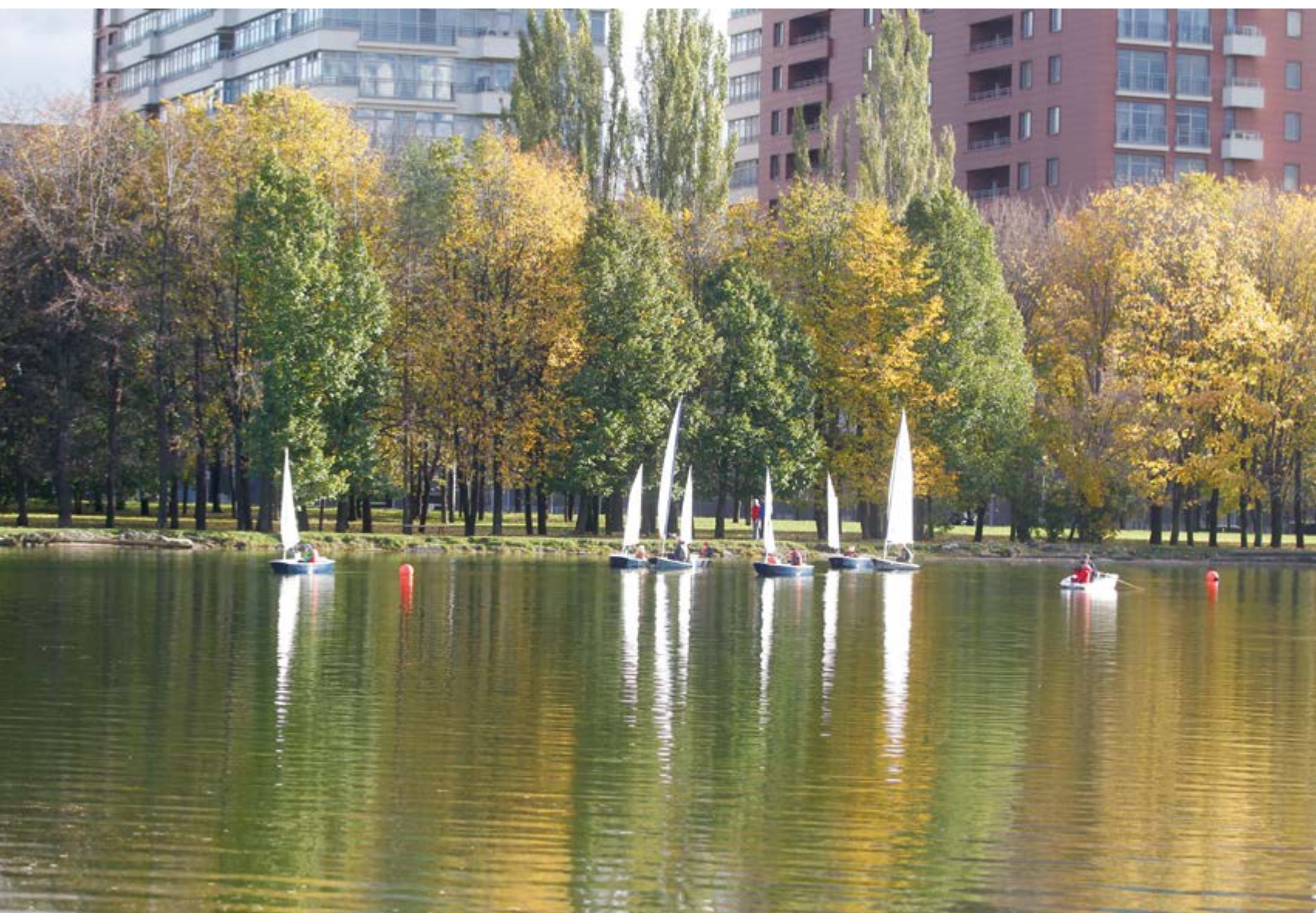
v Практические занятия по управлению яхтой