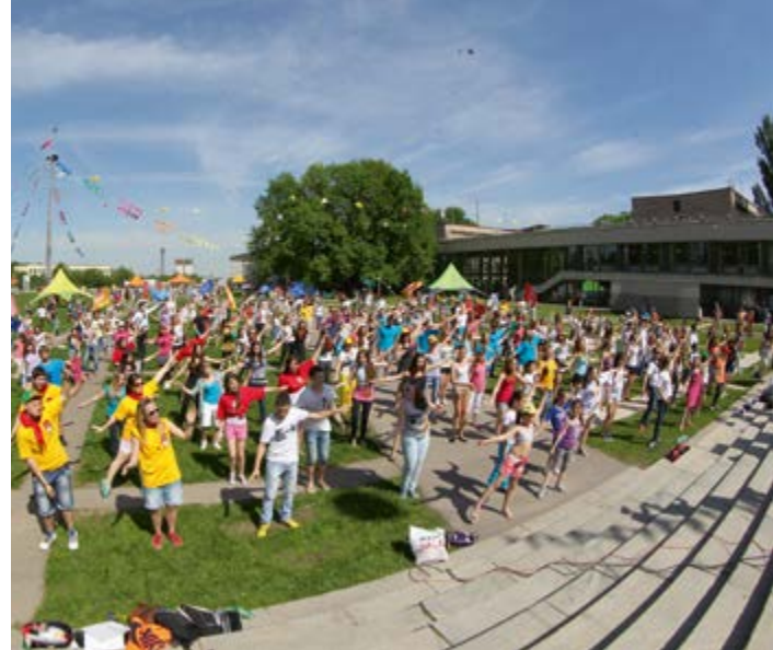
^ Площадь парадов. Утренняя зарядка