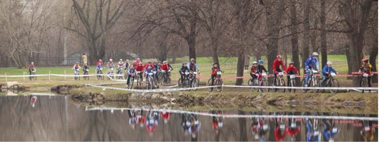
^ Осенний веломарафон

спортивных направлений и правильное расположение на территории позволяют эффективно ее использовать в любое время года.