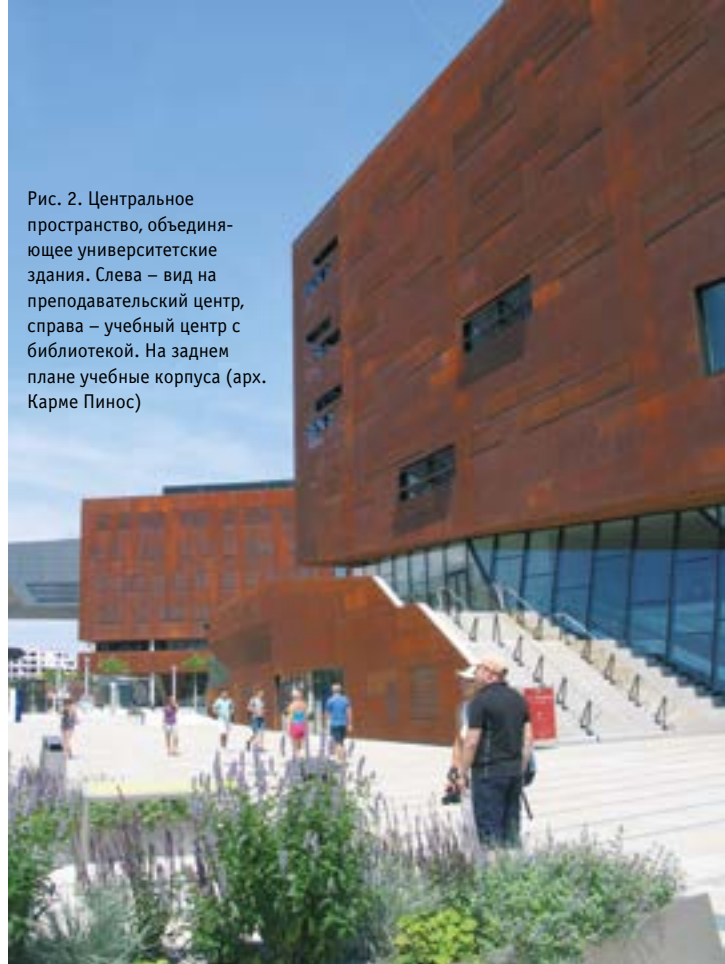
Рис. 2. Центральное пространство, объединяющее университетские здания. Слева – вид на преподавательский центр, справа – учебный центр с библиотекой. На заднем плане учебные корпуса (арх. Карме Пинос)