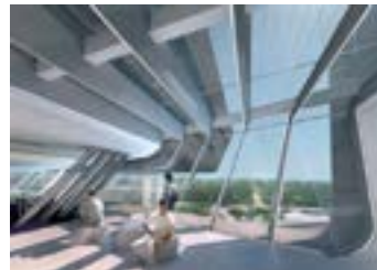
v Рис. 5. Интерьеры учебного центра