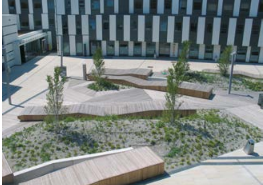
^ v Рис. 9. Элементы среды и благоустройства общественного пешеходного пространства Венского университета экономики и бизнеса