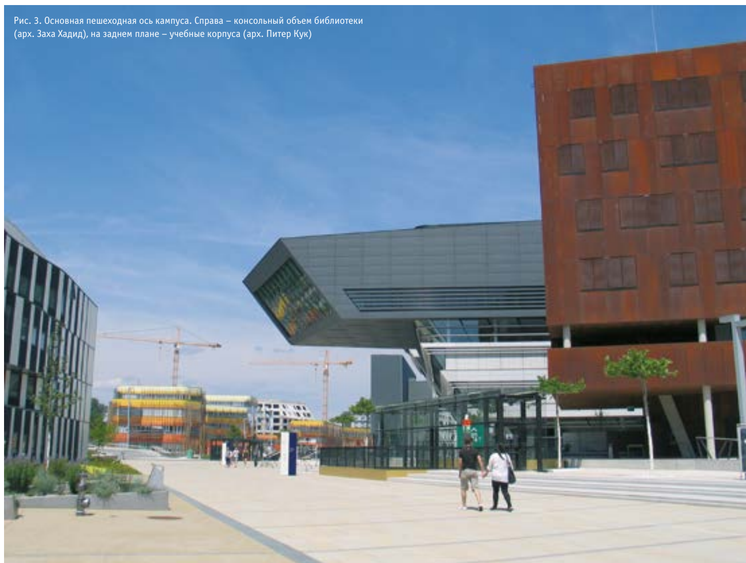
Рис. 3. Основная пешеходная ось кампуса. Справа – консольный объем библиотеки (арх. Заха Хадид), на заднем плане – учебные корпуса (арх. Питер Кук)