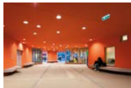
^ Рис. 7. Интерьеры помещений учебного корпуса