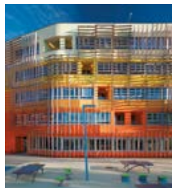
^ Рис. 6. Фрагменты фасадов комплекса зданий факультета права и администрации