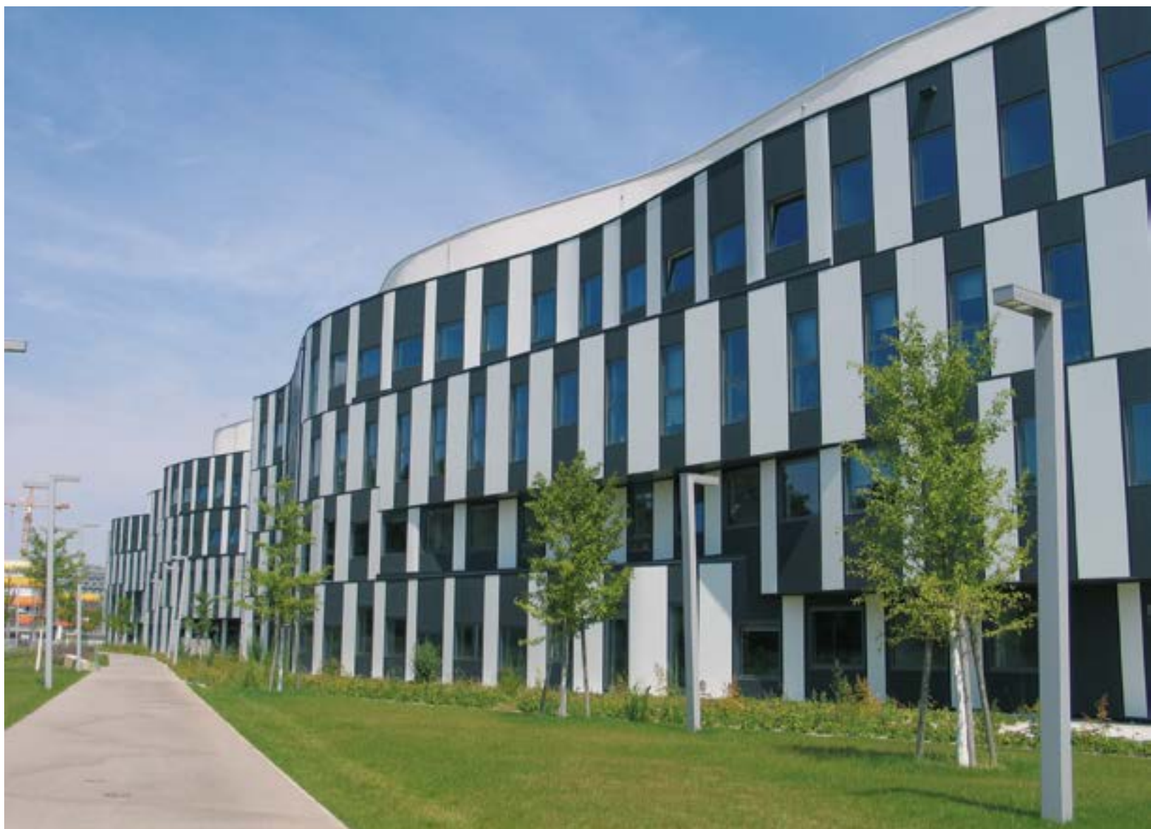
v Рис. 8. Новый кампус Венского университета экономики и бизнеса. Вид со стороны парка Пратер. На переднем плане – учебные корпуса (арх. Хитоши Абэ)