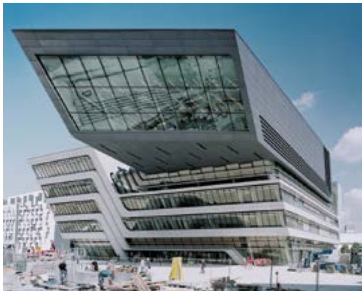
< Рис. 4. Библиотека и учебный центр (арх. Заха Хадид). За панорамным остеклением верхнего объема – читальный зал с видом на зеленый парк