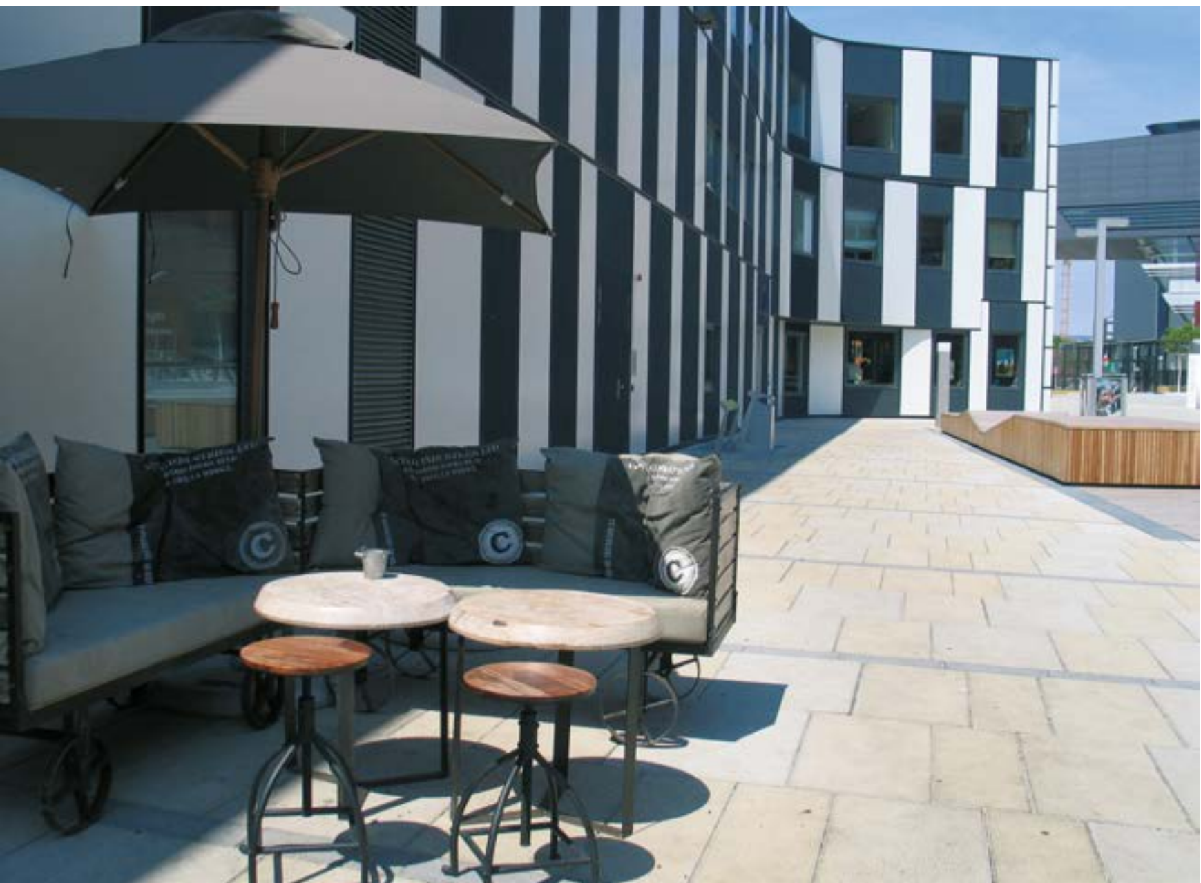
в Рис. 9. Элементы среды и благоустройства общественного пешеходного пространства Венского университета экономики и бизнеса

Цыредарь Дагданова Мария Табитуева / Tsyredar Dagdanova Maria Tabitueva