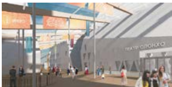
< Консорциум «Vittorio Grassi Architetto & Якутагропромпроект»

рах». Тема традиции продолжается внутри зданий, но уже с использованием натуральной древесины, текстиля на стенах и других теплых материалов. Это создает контраст между внутренним и внешним, что играет важную роль в архитектуре.