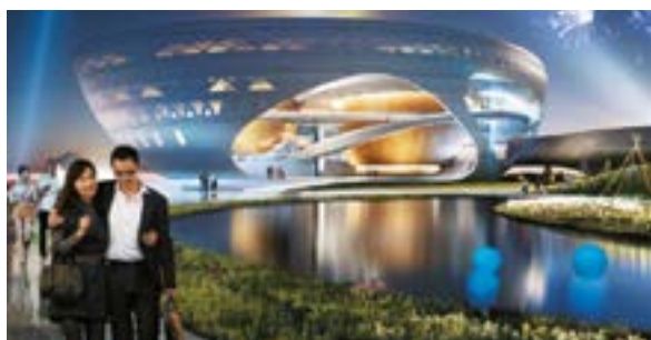
> ^ 000 «АМ "Атриум"», Lap Landscape & Urban Design