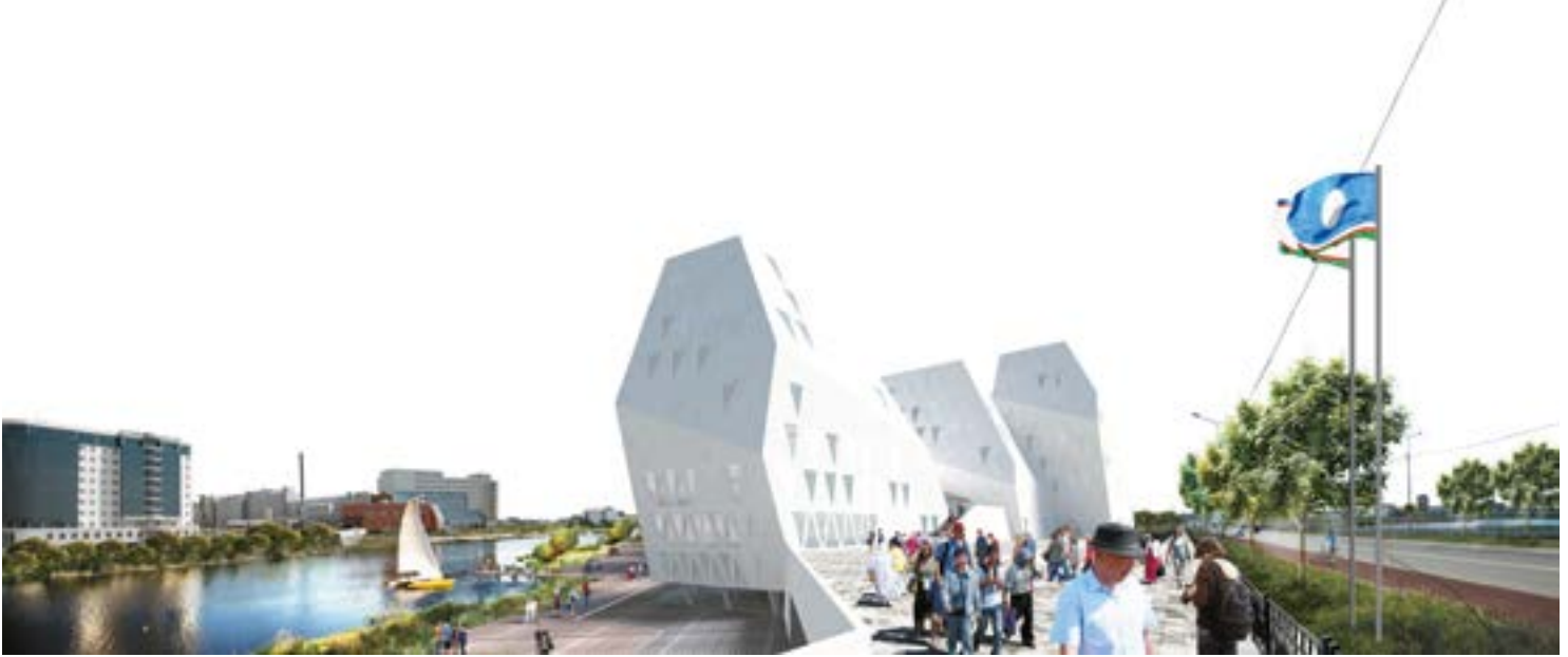
^ v Консорциум «Vittorio Grassi Architetto & Якутаг- ропромпроект»