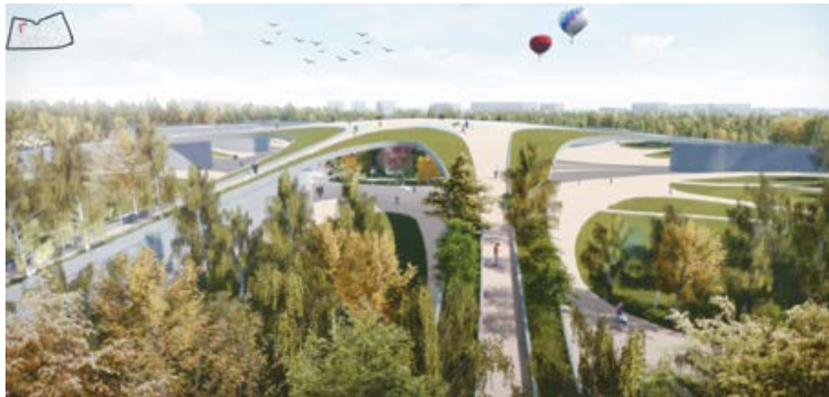
< ^ Консорциум «Rubio and Alvarez-Sala (R&AS) & Francisco Mangado Arquitectos»