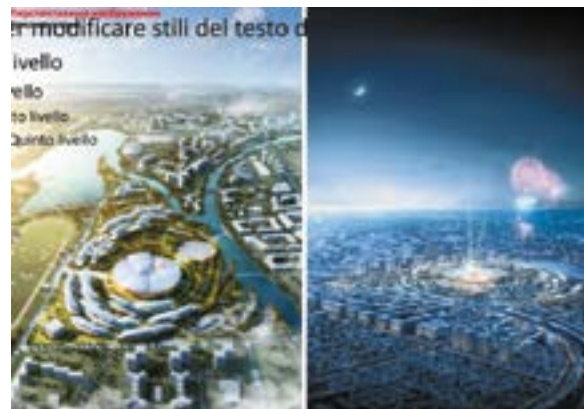
^ Консорциум «Fuksas & Саханпроект»