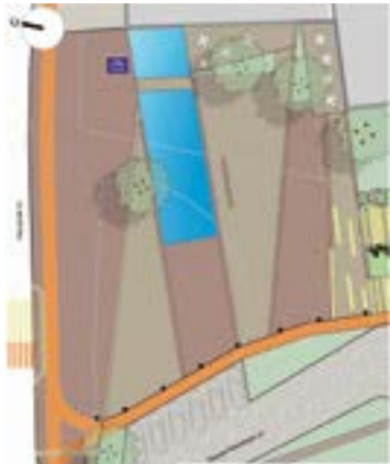
^ Вариант 1