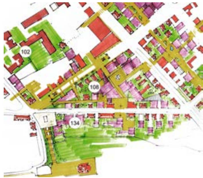
^ Кварталы 102, 108, 134. Эскиз 2014 г.

Keywords: panorama of Irkutsk; sandstone; larch tree; new urban rituals.