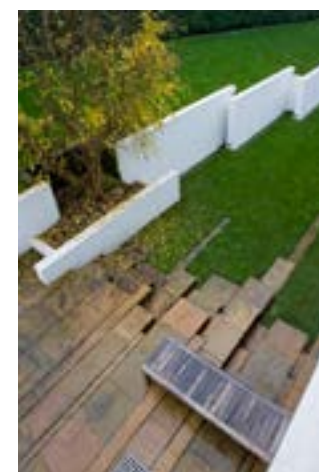
^ Аналоги проектных решений для фрагментов мощения, подсветки, озеленения, уличной мебели

Комбинация вышеперечисленных приемов подсветки украсит панораму при обзоре как с нижней площади и прилегающих к горе улиц, так и с видовой площадки.