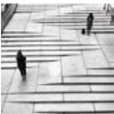
v > Вариант 2

Мощение лестницы выполняется натуральным камнем, плиткой натуральных цветов, близких к золотистому цвету традиционного для Иркутска песчаника. При приближении к деревянной площади в мощении появляются деревянные вкрапления. Дерево, пропитанное соответствующим образом для повышения прочности и долговечности, и высококачественные материалы, имитирующие дерево, используются и в оформлении скамеек, элементов ограждений.