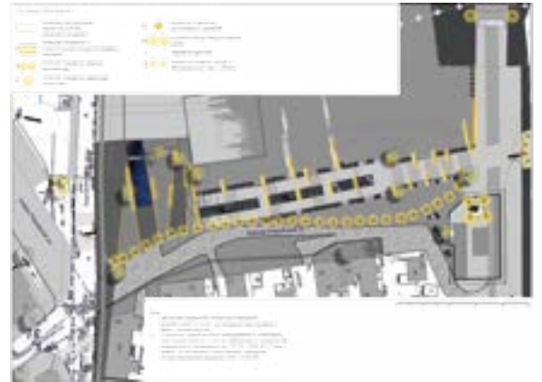
^ Архитектурное освещение

зеленого цвета, может быть и двухцветной – желтой и зеленой.