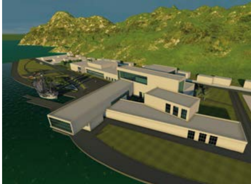
Музей истории судоходства на о. Байкал в п. Листвянке Автор А. А. Ракислова, руководитель А. А. Ляпин

Keywords: urban development of Irkutsk; architectural development; graduation project; museum space; architectural student competitions; development of tourism.