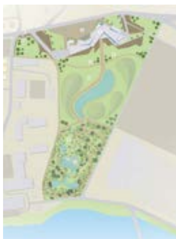
v ^ Музейный комплекс искусств стран Востока в Иркутске Автор А. Б. Валеева, руководитель А. А. Ляпин