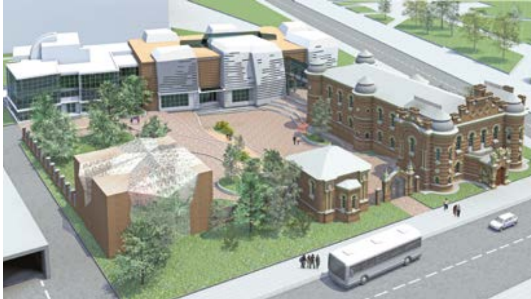
< Реконструкция комплекса построек Иркутского краеведческого музея Автор А. В. Зюбр, руководитель А. А. Ляпин