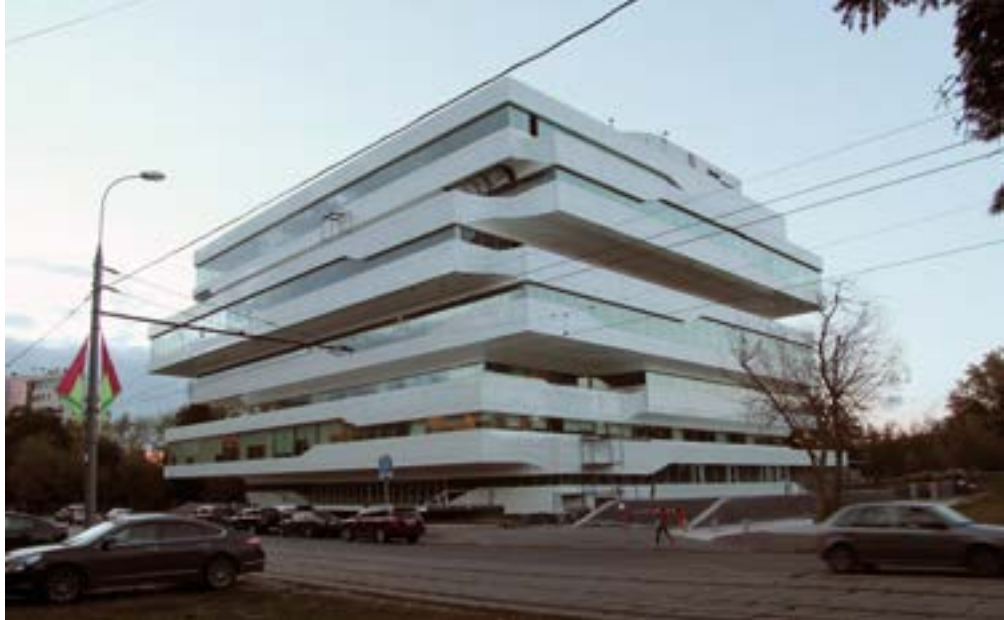
> Рис. 1. Бизнес-центр Dominion Tower

Keywords: the architect of the future; constructivism in modern architecture; author's style.