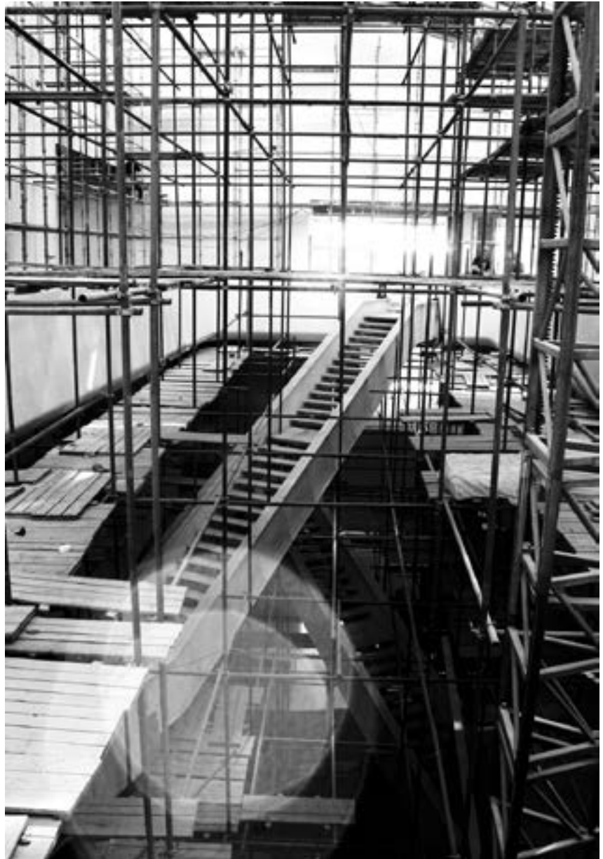
v Рис. 6. Монтаж лестницы в интерьере Dominion Tower

В интерьере бизнес-центра можно выделить три основных объема – атриум, амфитеатр и лестницу, которые отсылают к ведущим конструктивистам XX века. Атриум, амфитеатр и лестница вместе создают уникальное пространство, где проработаны все детали – от мебели до элементов освещения. В интерьере центром здания является внутренний атриум с естественным освеще-