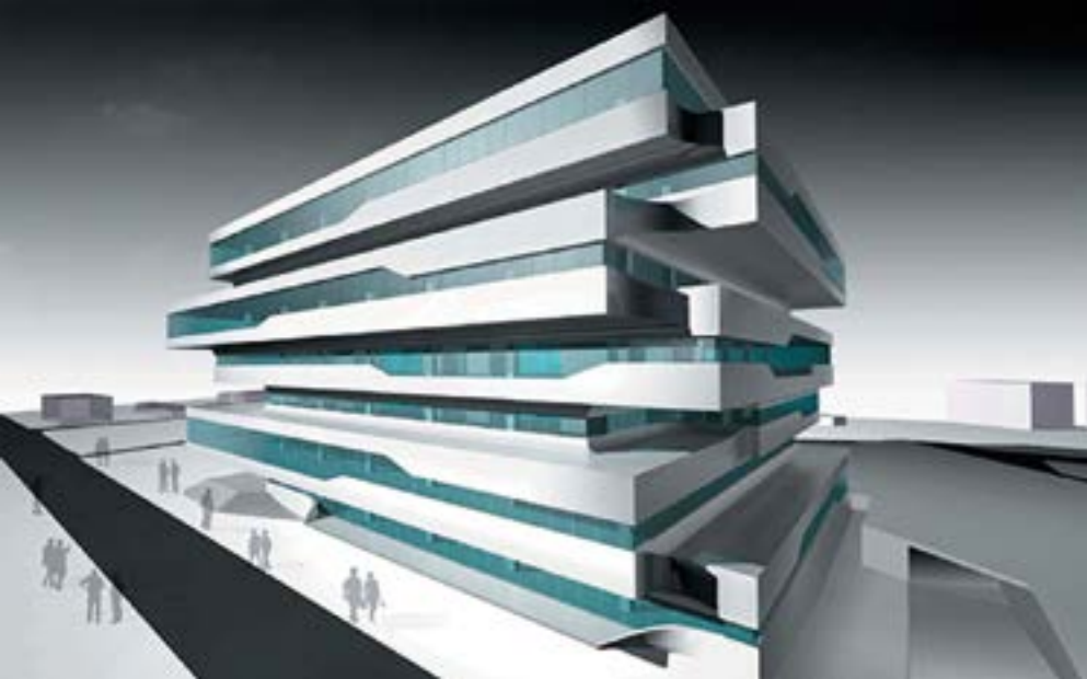
< v Рис. 2. Проекты Dominion Tower