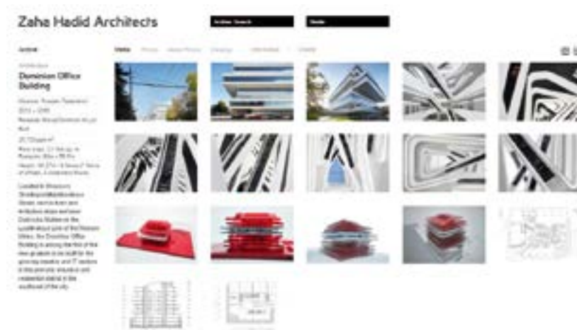
v Рис. 3. Проект Dominion Tower [1]

и жемужиной проекта. Представлены четыре снимка макета, показывающего слоистую структуру здания без наружной отделки стен, горизонтали бизнес-центра в правильных прямоугольных формах, что отсылает к закономерностям, присущим конструктивизму. Последние три изображения – это чертежи, помогающие восприятию внутреннего пространства. На них показаны входная часть и ее связь с атриумом на первом этаже; лестница на промежуточном этаже и разрез здания, обнажающий центральное ядро в целом (атриум, лестница).