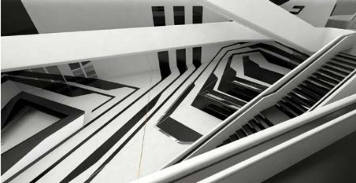
< Рис. 8. Амфитеатр Dominion Tower

мышлению авторов. В здании читается и любовь к четким формам конструктивизма, и переход к плавным и текучим формам природы – основные черты двух этапов творчества Захи Хадид.